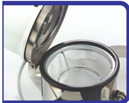
Sistema pulizia filtro/Filter-cleaning system