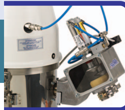
Valvola proporzionale PVB/Proportional valve PVB1