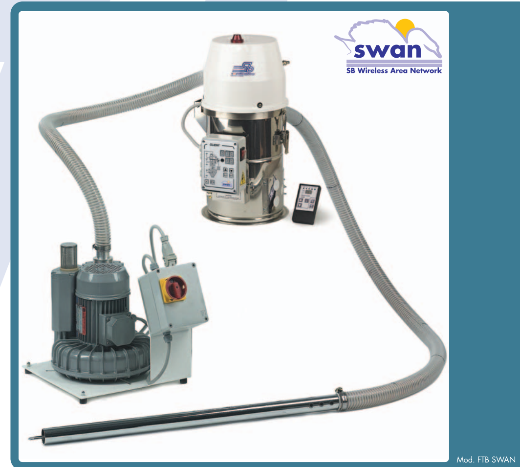
Mod. FTB SWAN