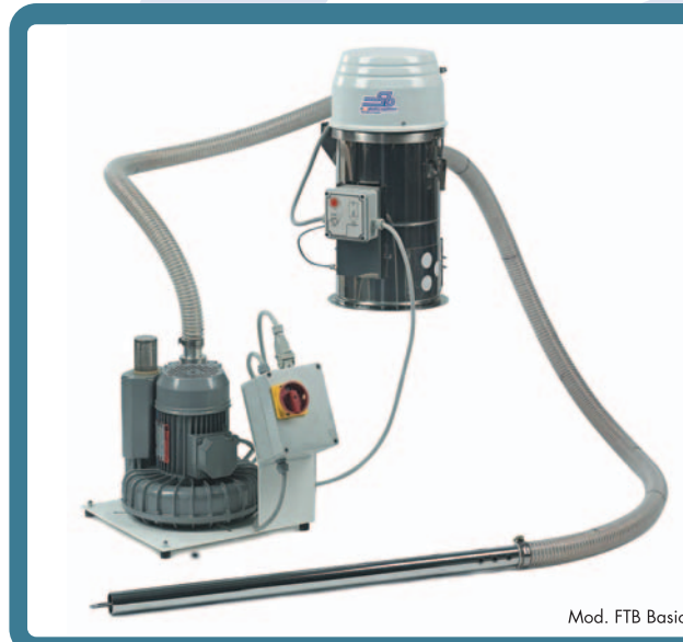
Mod. FTB Basic