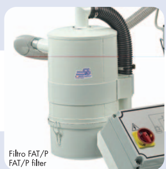
Filtro FAT/P FAT/P filter